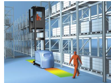
Sicherheitssysteme für den Material Handling