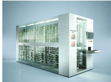
Automatische Systeme für Apotheken