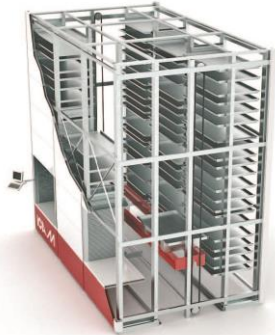
Vertikale automatische Lager